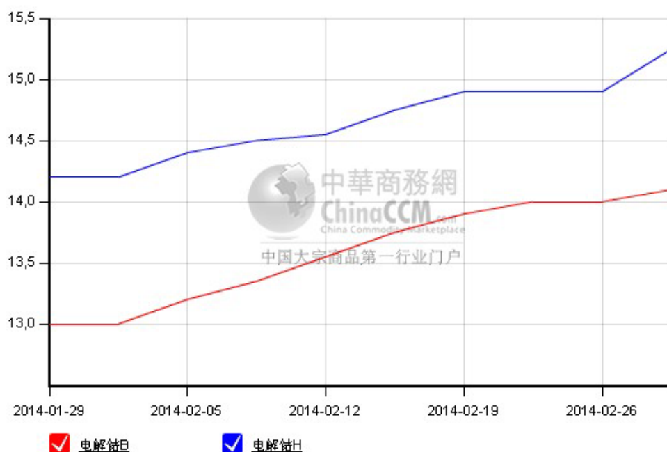
MB 钴精矿二月份走势图