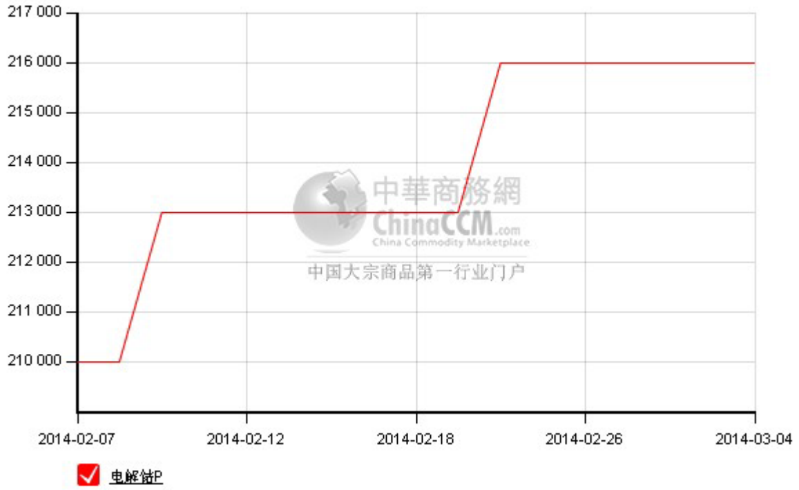
凯力克电解钴 2 月走势图