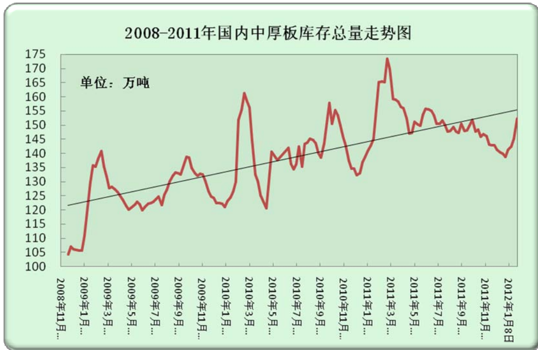
图二、国内中厚板库存总量走势图